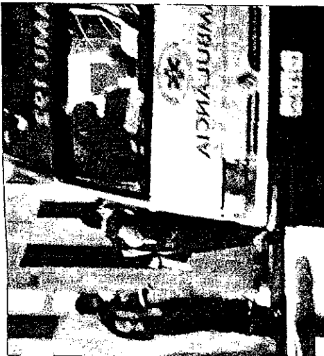
MU chegou a socorrer o motoqueiro, que morreu no trajeto